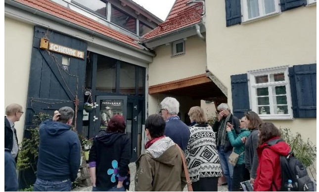
Vas. EU-komission pilottihankkeen työpajassa Brysselissä, oik. ViSENet-hankkeen matkassa Saksassa

Opastava Yhteisö -hanke on ollut Eskolan edustajana myös Ruralia-instituutin kylien yhteiskunnallista yrittäjyyttä kehittävässä ViSENet -hankkeessa. Siinä joukko kyliä eri puolilta Eurooppaa kehittää opintopakettia yhteiskunnallista yrittäjyyttä koskien. Projektipäällikkö osallistui keväällä 2019 ViSENet-hankkeen matkalle Saksaan ja tutustui kansainvälisiin yhteistyökumppaneihin. Myöhemmin yhteyttä pidettiin useiden etäkokousten avulla. Eskolan kyläpalvelukuvaus on tulossa pysyväksi hyväksi esimerkiksi skotlantilaisen InspirAlban ylläpitämään yhteiskunnallisten yritysten Rural Social Enterprise Hubiin. Eskolan Kyläpalvelu Oy on ViSENet -hankkeen myötä kyseisen yhteenliittymän jäsen, ja projektipäällikkö on toistaiseksi toiminut sen edustajana.