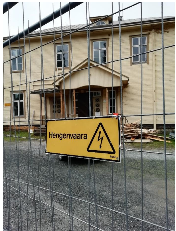
Tätä kylttiä ei tällä hetkellä tarvitse Lossari-keskuksen työmaalla pitää, työt edistyvät hiljalleen.

Itse opastusmateriaali on jo pitkälti valmista ja sisältää hyviä peruspalikoita uusien opastusten suunnitteluun, ja Opastava Yhteisö -hanke järjesti jo ensimmäisen opaskurssin syksyllä 2019. Vastaavia kurseja on helppo järjestää uusia, sillä kurssimateriaali on valmista. Konkreettisten opastaulujen suunnittelu keskuksen kannattaa tehdä vasta remontin valmistuttua ja sisätilaratkaisujen selvittyä lopullisesti.